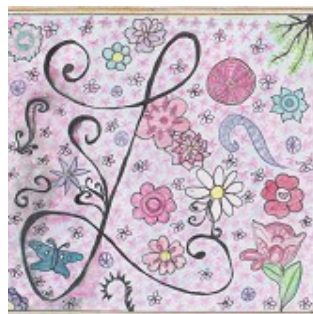
Enluminure de Lola