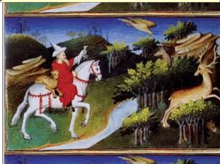
Miniature, tirée du Livre des Merveilles