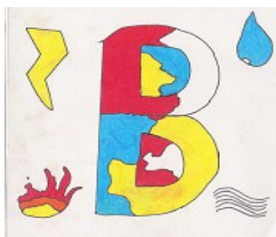
Enluminure de Baptiste